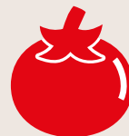
Pomodori, pomodori da trasformazione e ortofrutta

Anche la linea "Origine" si evolve. Il marchio Origine diventa un "bollo di garanzia Coop" e lo troverai sulle confezioni dei prodotti che provengono dalla filiera garantita da Coop. Le Filiere controllate Coop consentono infatti di ricostruire la storia di ogni prodotto, con l'identificazione delle aziende coinvolte lungo il percorso che porta il prodotto dal campo allo scaffale. Così in ogni momento puoi risalire agli operatori che hanno preso parte alle diverse fasi di produzione.