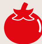
Pomodori, pomodori da trasformazione e ortofrutta

Anche la linea "Origine" si evolve. Il marchio Origine diventa un "bollo di garanzia Coop" e lo troverai sulle confezioni dei prodotti che provengono dalla filiera garantita da Coop. Le Filiere controllate Coop consentono infatti di ricostruire la storia di ogni prodotto, con l'identificazione delle aziende coinvolte lungo il percorso che porta il prodotto dal campo allo scaffale. Così in ogni momento puoi risalire agli operatori che hanno preso parte alle diverse fasi di produzione.